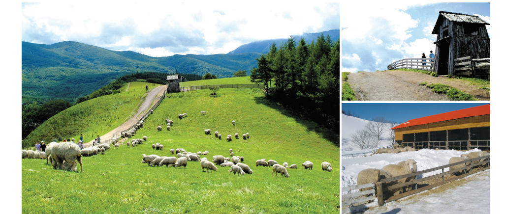
#한국의알프스 #양밭주기 #양귀여워 #초원도멋져! #설경은더예뻐

#양떼목장에서 폭신폭신 귀여운 양과 힐링타임! ☎ 대관령면 대관령 마루길 483-32 ☎ 033-335-1966 🌐 www.yangtte.co.kr