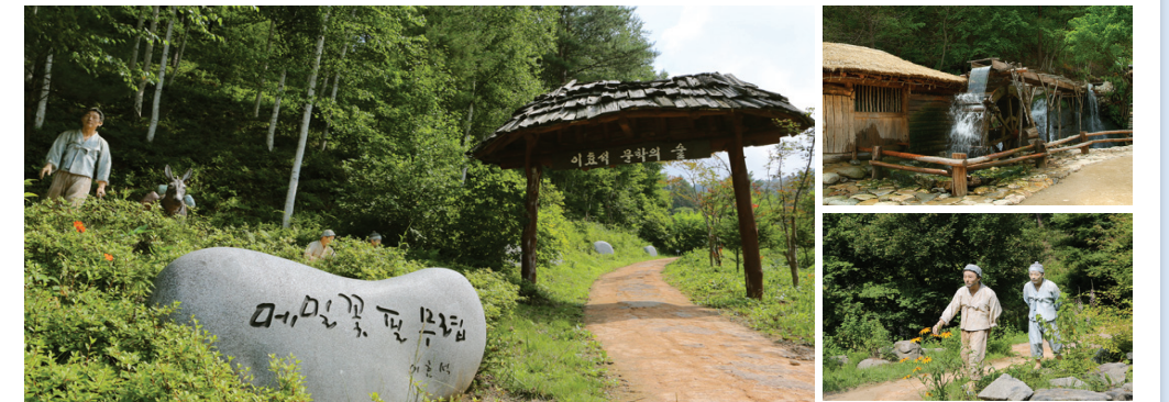
#봄부터가을까지만개방 #소설속캐릭터들 #소설속장소들 #물레방앗간

책 속 세상이 눈 앞에 펼쳐지는 #이효석 문학의 숲 ☎ 봉평면 문학숲길 97 ☎ 033-335-4477 🌐 문학의숲.com