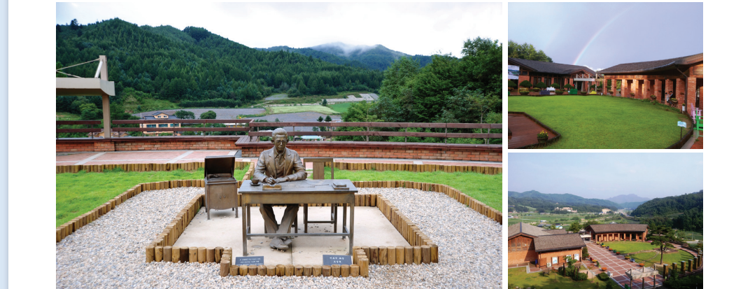
#이효석작가이야기 #사계절아름다운풍경 #문학의향기 #데이트코스

<메밀꽃 필 무렵>의 풍경이 가득한 #이효석 문학관 ☎ 봉평면 효석문화길 73-25 ☎ 033-330-2700 🌐 www.hyoseok.org