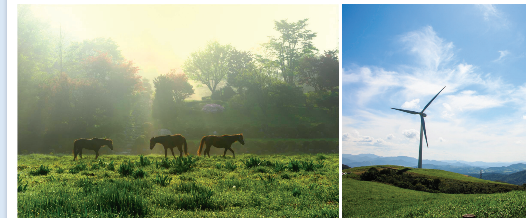
#트랙터타차 #양떼체험 #승마체험 #아이들과목장의자연속으로

눈이 시리도록 투명한 하늘 아래 #하늘목장 ☎ 대관령면 황계리 산279-7번지 ☎ 033-332-4888 🌐 skyranch.co.kr