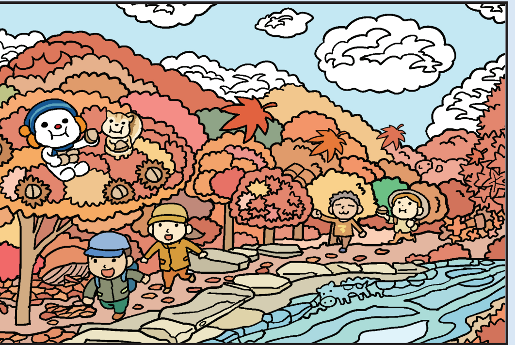
#풍차 #양 #젓소 #메밀국수 #박쥐 #고래 #바늘 #춧불 #책 #불가사리

매년 가을이 되면 평창 구석구석이 알록달록 물들며 장관을 이루죠. 그 중에서도 오대산의 가을 풍경이 최고로 꼽히는 것, 다들 알고계시죠? 올 가을엔 평창에서 단풍놀이를 즐겨보세요~ ※ 각 페이지의 QR코드를 통해 관광지 소개영상을 감상하고, 각 관광지 홈페이지에 접속할 수 있습니다.