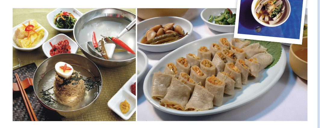
#봉평읍내가특메밀음식점 #메밀막국수 #메밀묵 #메밀전병 #메밀씩비빔밥

눈으로 메밀꽃을 즐겼다면 입을 위해 #메밀음식거리로! ☎ 봉평면 봉평읍내