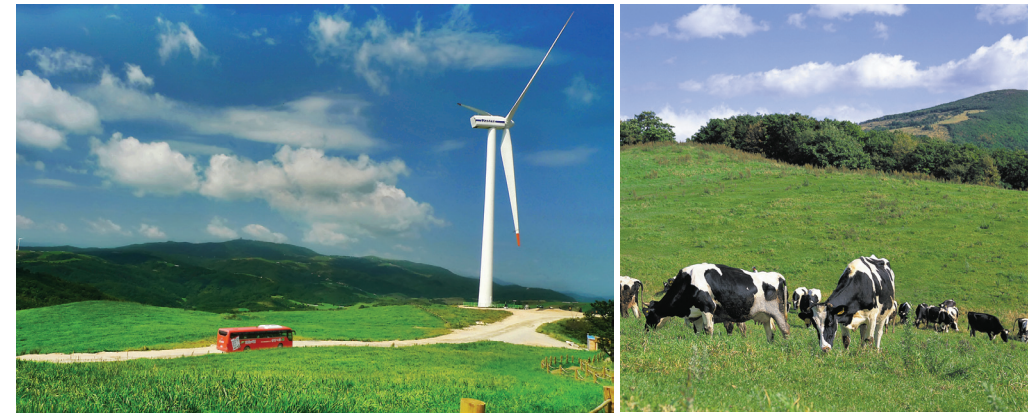
#서울여의도의7.5배크기 #동양최대규모초지목장 #가을동화촬영지

끝없이 펼쳐진 아름다운 대관령의 초원 #에코그린캠퍼스 ☎ 대관령면 황계2리 산1-107번지 ☎ 033-335-5044 🌐 www.samyangranch.co.kr