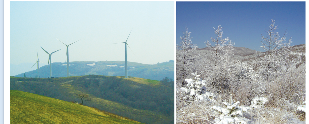
#백두대간능선올한눈에 #완만한산세 #등산초보자에게도추천!

바람과 함께 걷는 #선자령 풍차길 ☎ 대관령면 황계리 ☎ 033-330-2771